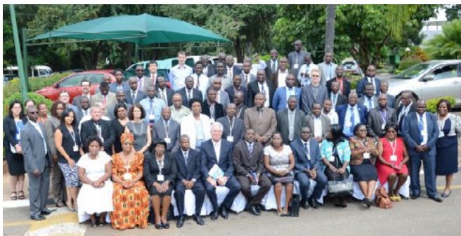
Participantes en el Foro de la EFTP, Formación de docentes y Ecologizar la EFTP de África Meridional.