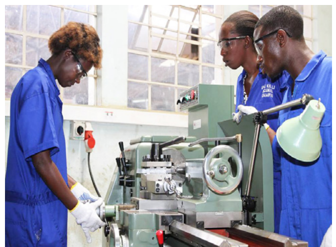
SkillsinAction concours photo Prix des médias sociaux