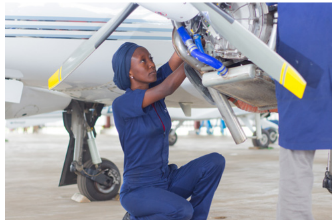
SkillsinAction concours photo premier prix

Plus de 50 Centres UNEVOC de 40 pays ont organisé des manifestations rassemblant différents acteurs en vue de sensibiliser aux avantages du développement des compétences pour les jeunes. Des ministères, des organismes nationaux, des établissements de formation ont organisé des concours de compétences, des expositions, des conférences et des ateliers, de même que des cours de formation s'adressant aux apprenants, aux enseignants, aux décideurs et à la communauté locale.