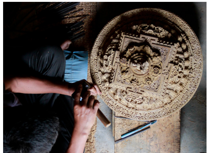
SkillsinAction concours photo deuxième prix