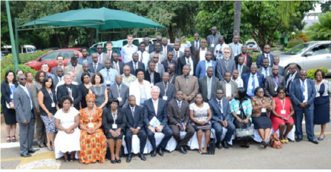
Participants au Forum régional d'Afrique australe de formation des enseignants de l'enseignement et de la formation techniques et professionnels et d'écologisation de l'EFTP